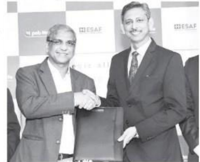
آتش کمار سربراہان اور کے پال تمنا سے معاہدہ کے بعد۔

ممبئی (ایجنسی) ملک کی ۱۰ بہترین انشورنس کمپنیوں میں سے ایک پی این بی میٹ لائف نے دیہی علاقوں میں رسائی کیلئے کیرالا سے تعلق رکھنے والی ایساف انشورنس بینک سے